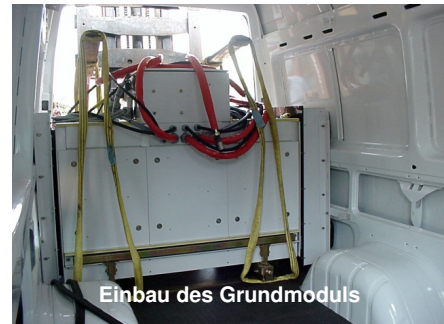
Einbau des Grundmoduls

Der Dieselmotor läuft mit konstanter Drehzahl von 3.000 U/min (je nach Leistungsklasse). Der Verdichter der Klimaanlage wird direkt vom Dieselmotor mechanisch über Keilriemen angetrieben. Über einen zweiten Kühlmittelkreislauf können Rackkühlmodule mit eigenen elektronischem Einspritzventil angeschlossen werden, die unabhängig von der Kabinenraumlufttemperatur Schaltschränke kühlen bzw. heizen. Der Generator wird ebenfalls wie der Verdichter über Keilriemen vom Dieselmotor mit 3.000 U/min. angetrieben.